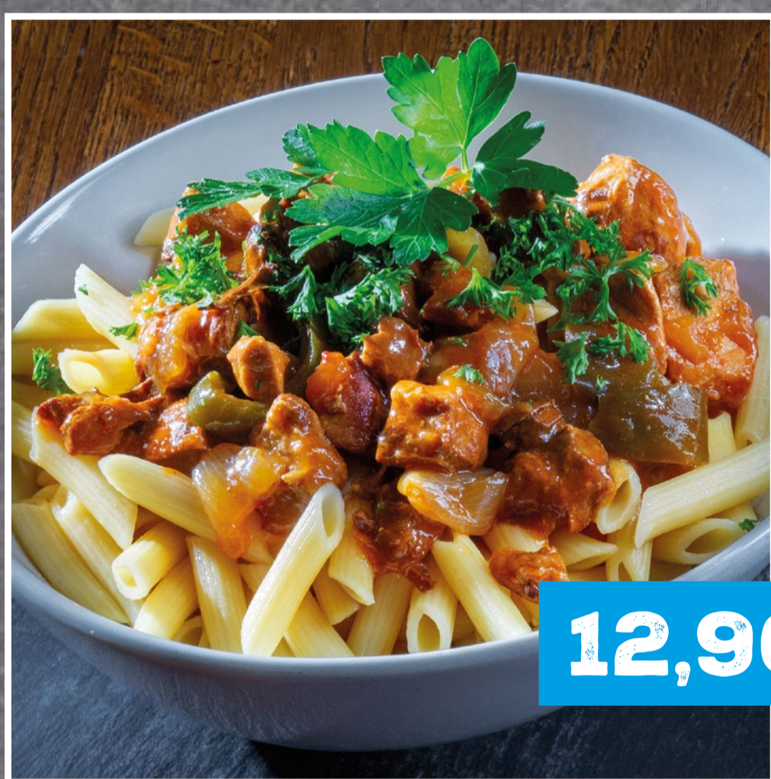
TEUFELSGULASCH MIT PENNE