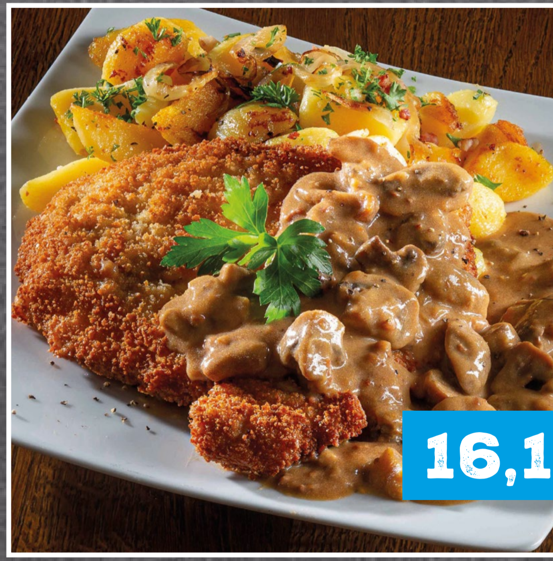
SCHNITZEL JÄGER ART