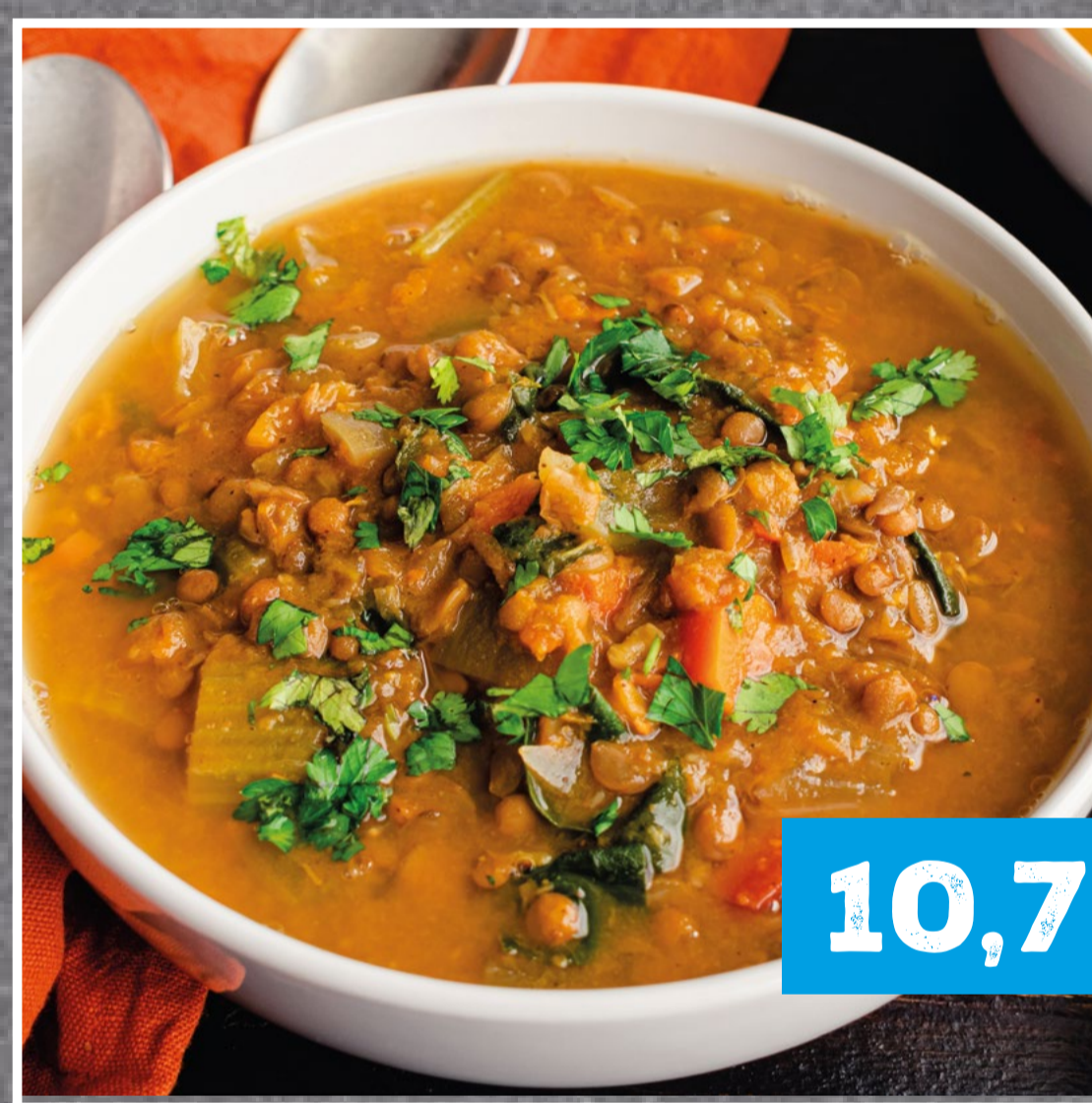
LINSEN CURRY & ERBSEN-MINZ-TALER