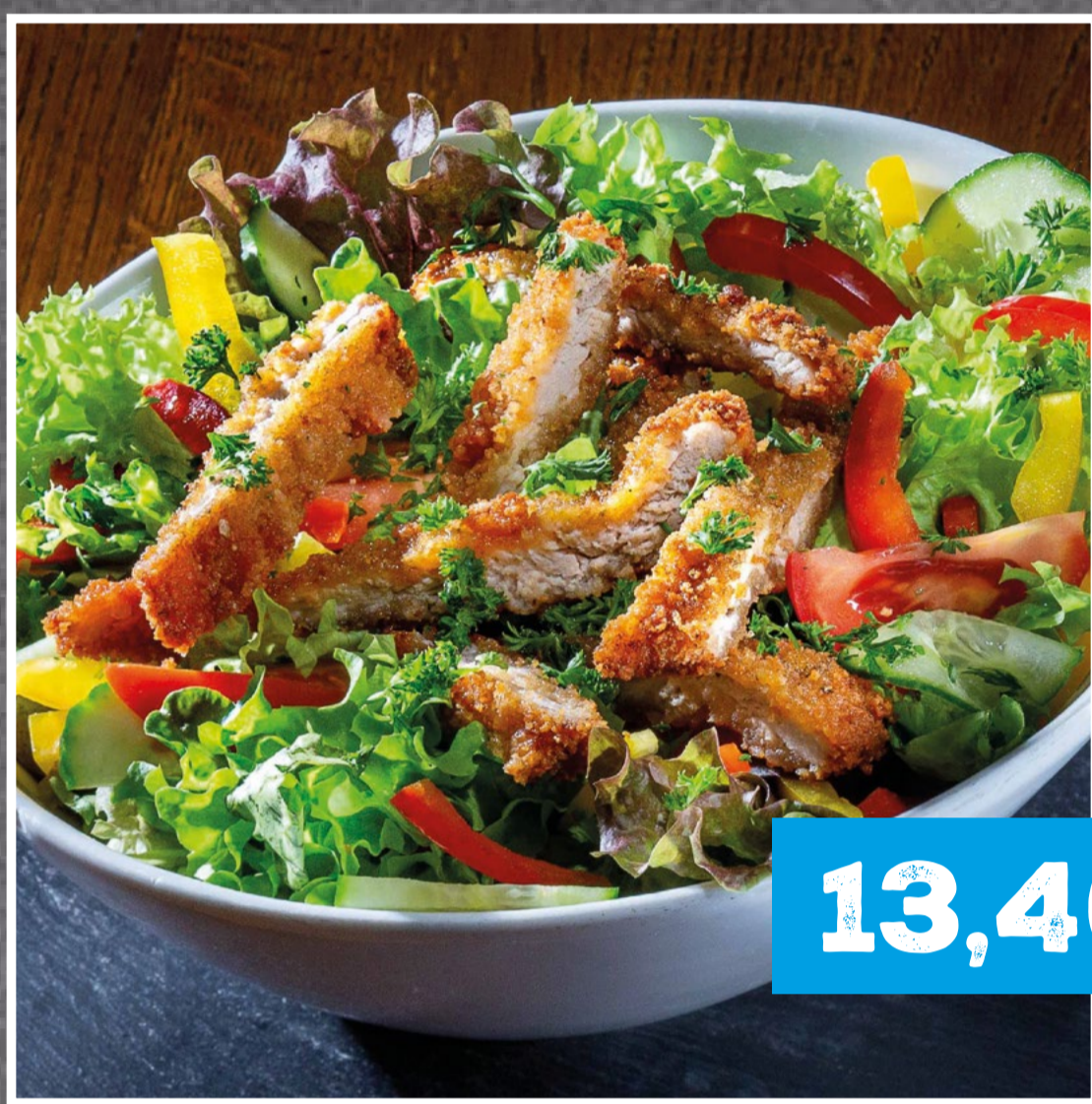
SALAT MIT SCHNITZELSTREIFEN