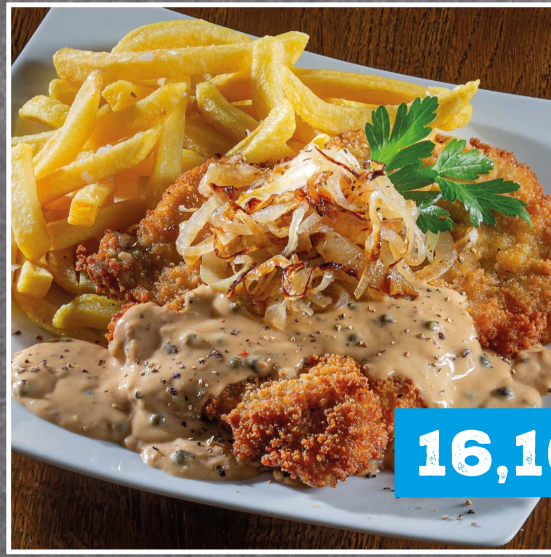
SCHNITZEL GROSSMUTTERS ART